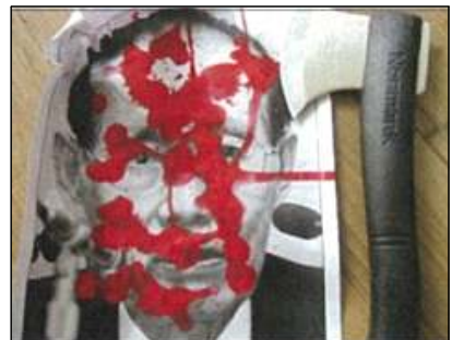
'06.12 황장엽에게 발송된 도끼 및 협박편지