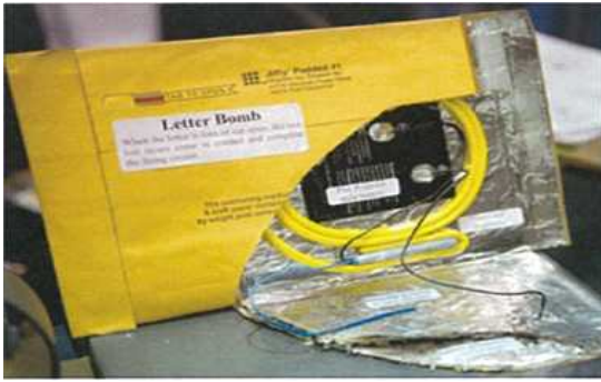
< 전형적인 형태의 소포폭탄 >