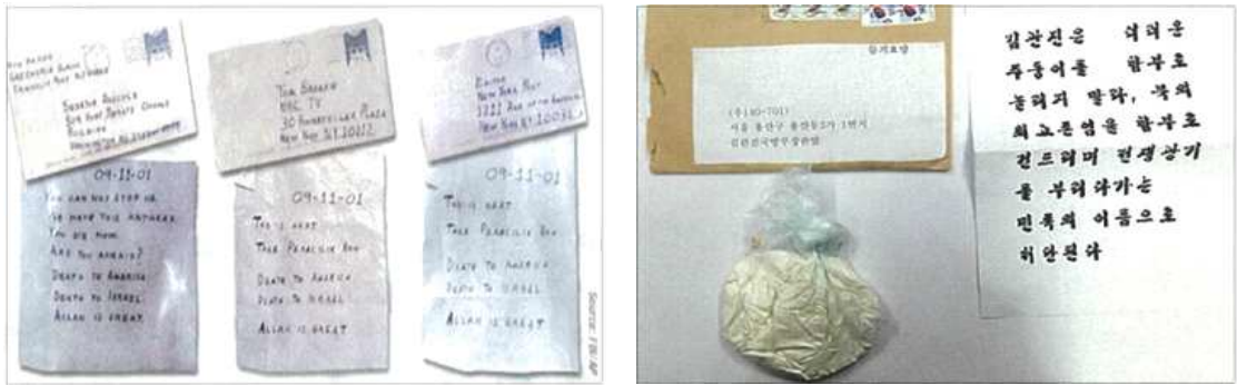
< 2001년 탄저균 테러에 이용된 편지 > < 김관진 국방부 장관 앞 배달 편지 >